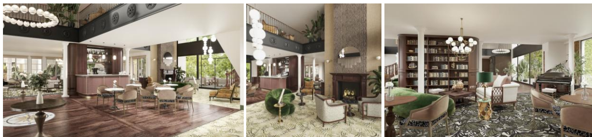
Images du hall d'entrée de la Résidence Services Seniors Villa Beausoleil Brest.

Ces nouvelles ouvertures s'inscrivent dans le cadre d'un plan de développement ambitieux mais raisonné visant à développer une offre de grande qualité. L'année 2022 sera ainsi marquée par l'ouverture d'une autre Villa Beausoleil Résidence Services Seniors à Drancy (93).