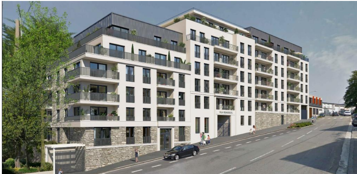
Vue extérieure de la Résidence Services Seniors Villa Beausoleil Brest La Villa Beausoleil Brest (29) sera la 18 e maison ouverte par Steva.

Entièrement développée et construite par les équipes de Steva Développement, la résidence Villa Beausoleil Brest est idéalement située sur un terrain acheté à l'ADAPT. La résidence a été vendue à la découpe à des particuliers par l'intermédiaire de Sérénissimo.